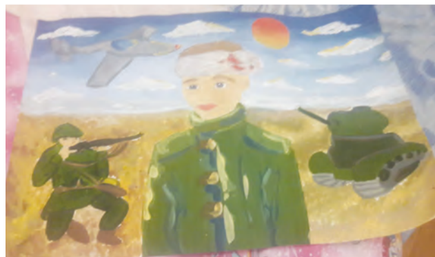
Рисунок Марьяны Байгузовой

Самая многочисленная номинация – «Хореография». Она собрала 58 юных танцоров. Меньше всего участников в номи-