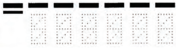
ОБРАЗЕЦ НАПИСАНИЯ ЦИФР В ИЗБИРАТЕЛЬНЫХ БЮЛЛЕТЕНЯХ

Сначала (и это главное) необходимо выбрать партию (лучше ПАРТИЮ МИРА И РАЗВИТИЯ - №8